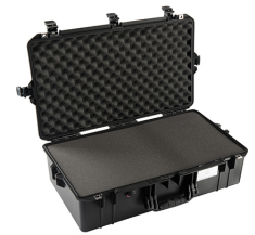
1605WF With Foam