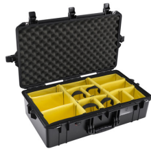
1605WD With Padded Dividers