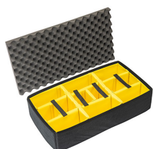
1605AirDS Cloison en mousse