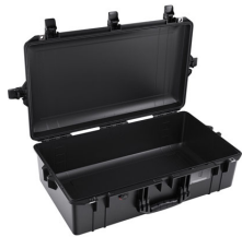
1605NF No Foam