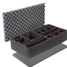
1605TPKIT Kit de séparation de la valise TrekPak