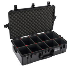
1605TP With TrekPak Divider System