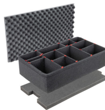
1615TPKIT Kit de séparation de la valise TrekPak