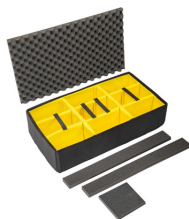
1615AirDS Cloison en mousse