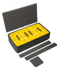
1615AirDS Cloison en mousse