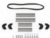
iM20XX-BEZEL Support de platine base