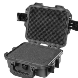
iM2050-X0001 With Foam