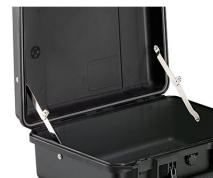
iM-LIDSTAY Compas de couvercle