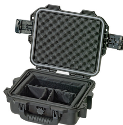
iM2050-X0002 With Padded Dividers