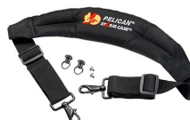
iM-STRAP-S-VER2 Bandoulière rembourrée