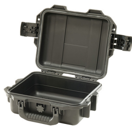
iM2050-X0000 No Foam