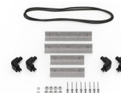
iM20XX-BEZEL Support de platine base