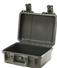
iM2100-X0000 No Foam