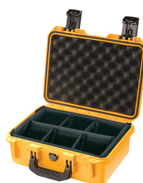
iM2100-X0002 With Padded Dividers