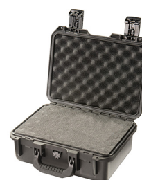
iM2100-X0001 With Foam