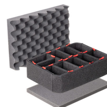
iM2100TPKIT Kit de séparation de la valise TrekPak