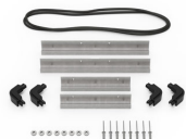
iM2100-BEZEL Support de platine base