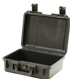
iM2200-X0000 No Foam