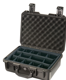
iM2200-X0002 With Padded Dividers