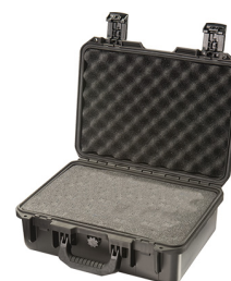
iM2200-X0001 With Foam