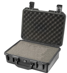
iM2300-X0001 With Foam