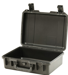
iM2300-X0000 No Foam