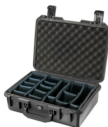
iM2300-X0002 With Padded Dividers