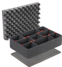
iM2300TPKIT Kit de séparation de la valise TrekPak