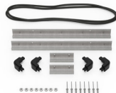
iM2306-BEZEL Support de platine base