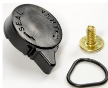
iM-VALVE-M-B Soupape de purge manuelle