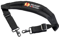
iM2370-STRAP-S Bandoulière rembourrée amovible