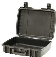
iM2370-X0000 No Foam