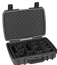
iM2370-X0002 With Padded Dividers