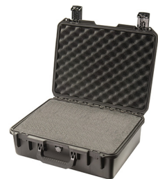
iM2400-X0001 With Foam