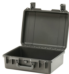
iM2400-X0000 No Foam