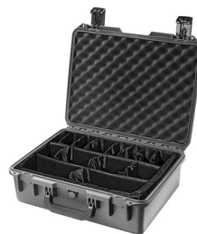
iM2400-X0002 With Padded Dividers