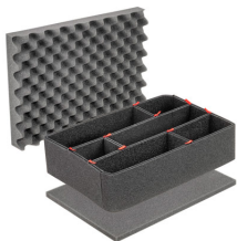
IM2400TPKIT Kit de séparation de la valise TrekPak