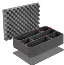
iM2400TPKIT Kit de séparation de la valise TrekPak