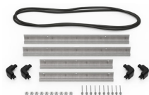
IM2450-BEZEL Support de platine base