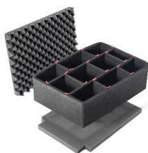
IM2450TPKIT Kit de séparation de la valise TrekPak