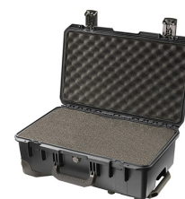
iM2500-X0001 With Foam