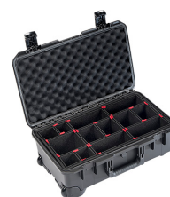
iM2500-X0006 With TrekPak Divider System