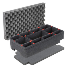
iM2500TPKIT Kit de séparation de la valise TrekPak