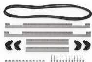
iM2500-BEZEL-LID Trousse de cadre de couvercle