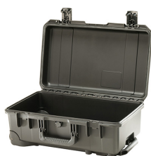
iM2500-X0000 No Foam