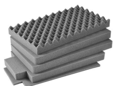
iM2500-FOAM Jeu de mousses de rechange, 5 pièces