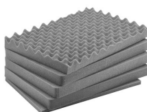
iM2600-FOAM Jeu de mousses de rechange, 5 pièces