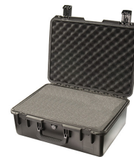
iM2600-X0001 With Foam