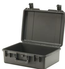
iM2600-X0000 No Foam