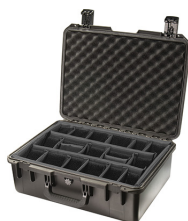
iM2600-X0002 With Padded Dividers