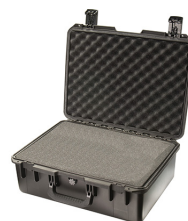
iM2600-X0001 With Foam