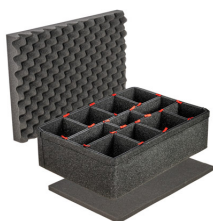
iM2600TPKIT Kit de séparation de la valise TrekPak