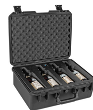
WHISKY-MULTIB Quad Whiskey