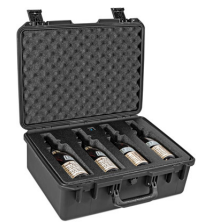
WHISKY-MULTIB Quad Whiskey