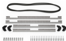
iM2700-BEZEL-LID Trousse de cadre de couvercle