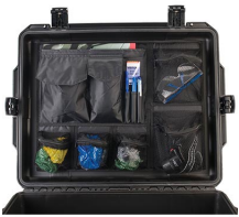
iM27XX-UTILITYORG Pochette utilitaire