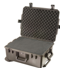
iM2720-X0001 With Foam