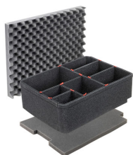
iM2720TPKIT Kit de séparation de la valise TrekPak