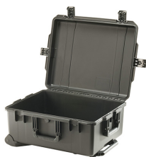
iM2720-X0000 No Foam