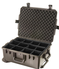
iM2720-X0002 With Padded Dividers