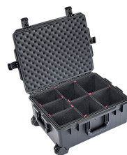
iM2720-X0006 With TrekPak Divider System