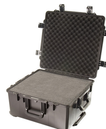
iM2875-X0001 With Foam