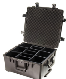
iM2875-X0002 With Padded Dividers