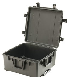
iM2875-X0000 No Foam