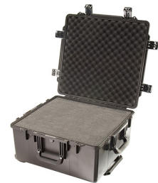
iM2875-X0001 With Foam