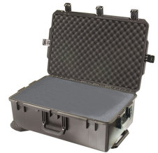
iM2950-X0001 With Foam