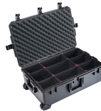
iM2950-X0006 With TrekPak Divider System