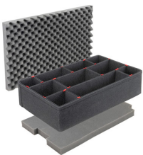
iM2950TPKIT Kit de séparation de la valise TrekPak