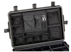
iM29XX-UTILITYORG Pochette utilitaire