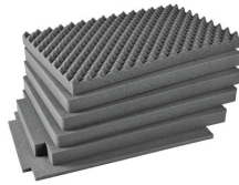
iM2950-FOAM Jeu de mousses de rechange, 6 pièces