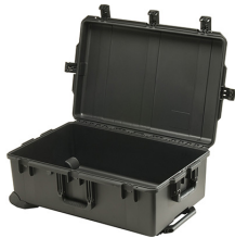
iM2950-X0000 No Foam