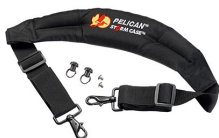
iM-STRAP-S-VER2 Bandoulière rembourrée