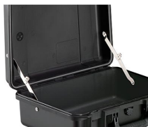
iM-LIDSTAY Compas de couvercle