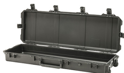
iM3200-X0000 No Foam