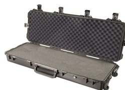
iM3200-X0001 With Foam