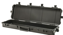
iM3300-X0000 No Foam