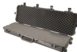
iM3300-X0001 With Foam