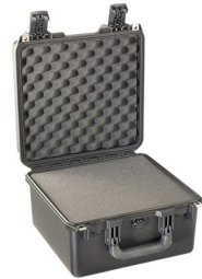
iM2275-X0001 With Foam