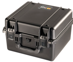
iM2275-X0000 No Foam