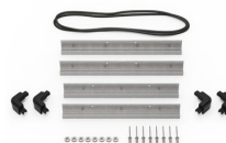
iM2275-BEZEL Support de platine base