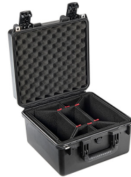
iM2275-X0006 With TrekPak Divider System