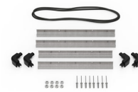
iM2275-BEZEL-LID Trousse de cadre de couvercle