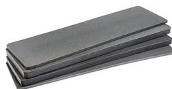
V800FS Jeu de mousses de rechange, 4 pièces