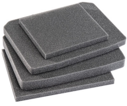
V100FS Jeu de mousses de rechange, 4 pièces