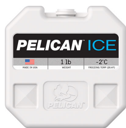
PI-1LB Bloc réfrigérant 1 lb