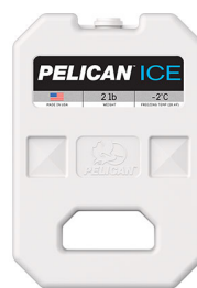
PI-2LB Bloc réfrigérant 2 lb

23215 Early Ave • Torrance, CA 90505 USA • Phone: (310) 326-4700 • (800) 473-5422 • Fax: (310) 326-3311 sales@pelican.com • www.pelican.com