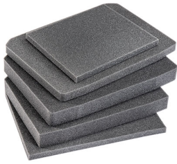
V200FS Jeu de mousses de rechange, 4 pièces