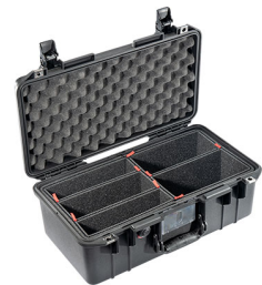
1506TP With TrekPak Divider System