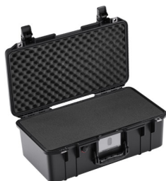
1506WF With Foam