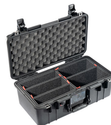
1506TP With TrekPak Divider System