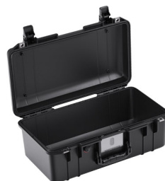
1506NF No Foam