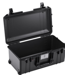
1556NF No Foam