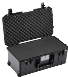
1556WF With Foam