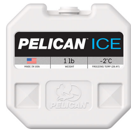
PI-1LB Bloc réfrigérant 1 lb