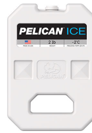
PI-2LB Bloc réfrigérant 2 lb