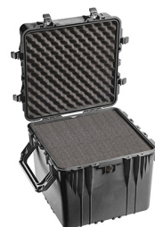
0350WF With Foam