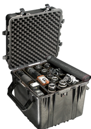
0354 With Padded Dividers