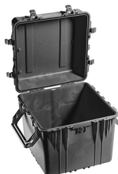
0350NF No Foam