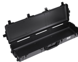
1755NF No Foam