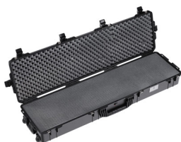
1755WF With Foam