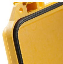
1703 Joint torique de remplacement