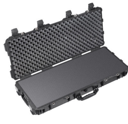
1700WF With Foam