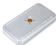
1500D Gel de silicone dessicant