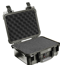
1400WF With Foam