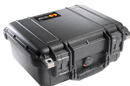
1400NF No Foam