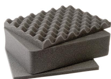
1401 Jeu de mousses de rechange, 3 pièces