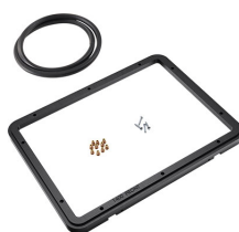
1400PF Cadre de panneau pour application spéciale