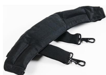
1432 Jeu de sangles