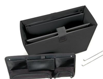
1436 Trousse de séparateurs bureau