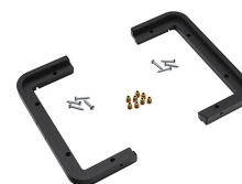
1430PF Cadre de panneau pour application spéciale