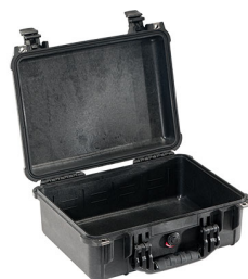
1450NF No Foam