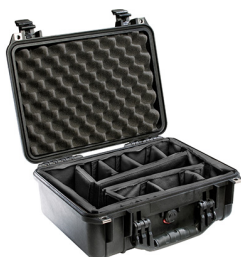
1454 With Padded Dividers