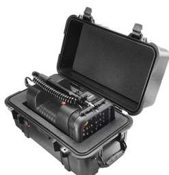
1460AALG With Custom Foam for 9430 / 9435