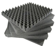
1461 Jeu de mousses de rechange, 6 pièces