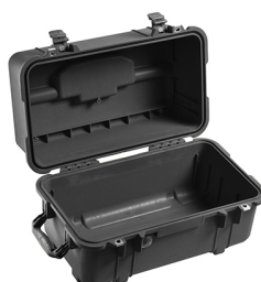
1460NF No Foam