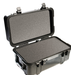
1460WF With Foam