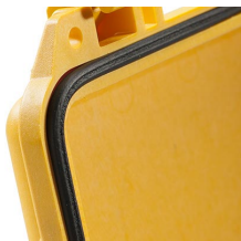
1463 Joint torique de remplacement