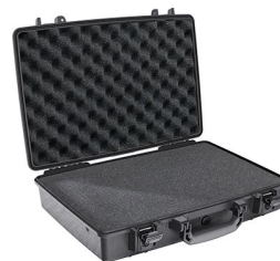
1490WF With Foam