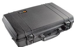
1490NF No Foam