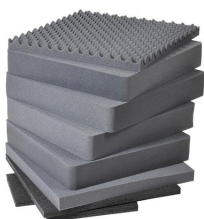
0371 Jeu de mousses de rechange, 8 pièces