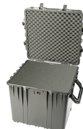
0370WF With Foam