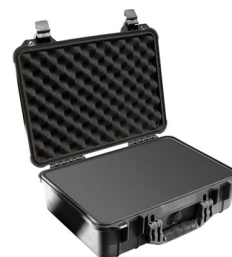
1500WF With Foam