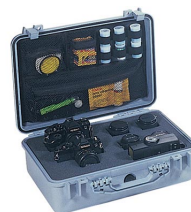
1508 Pochette couvercle photographe