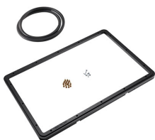
1500PF Cadre de panneau pour application spéciale