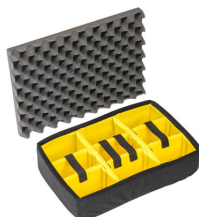
1505 Cloison en mousse