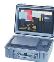
1509 Pochette couvercle