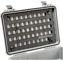
1500MP EZ-Click™ MOLLE Panel

23215 Early Ave • Torrance, CA 90505 USA • Phone: (310) 326-4700 • (800) 473-5422 • Fax: (310) 326-3311 sales@pelican.com • www.pelican.com