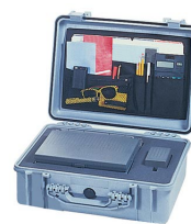
1509 Pochette couvercle