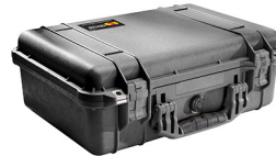
1500NF No Foam