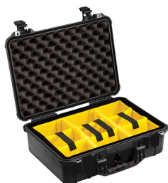
1504 With Padded Dividers