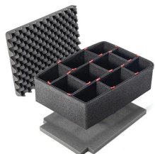
1500TPKIT Kit de séparation de la valise TrekPak