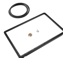
1520PF Cadre de panneau pour application spéciale