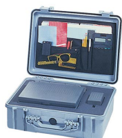
1509 Pochette couvercle