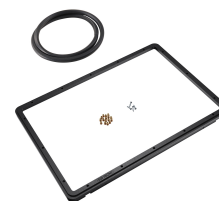
1520PF Cadre de panneau pour application spéciale