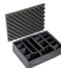
1525DS Cloison en mousse