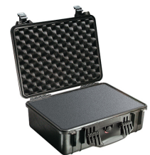
1520WF With Foam