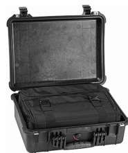
1526 With Convertible Travel Bag