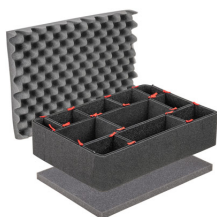
1520TPKIT Kit de séparation de la valise TrekPak