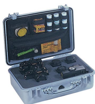
1508 Pochette couvercle photographe