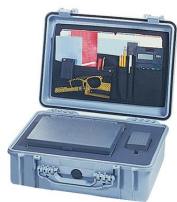
1509 Pochette couvercle