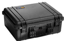
1550NF No Foam