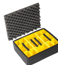
1555 Cloison en mousse