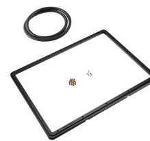
1550PF Cadre de panneau pour application spéciale