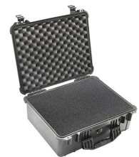
1550WF With Foam