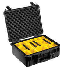
1554 With Padded Dividers