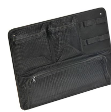
1569 Pochette couvercle