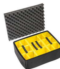
1565 Cloison en mousse