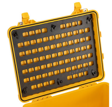
1560MP EZ-Click™ MOLLE Panel