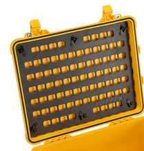
1560MP EZ-Click™ MOLLE Panel