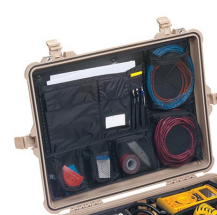
1609 Pochette couvercle