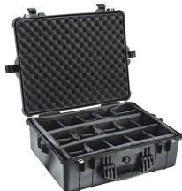
1604 With Padded Dividers