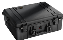
1600NF No Foam