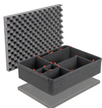
1600TPKIT Kit de séparation de la valise TrekPak