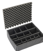
1605 Cloison en mousse