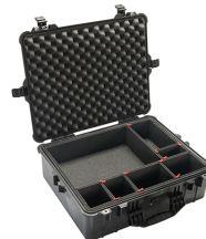
1600TP With TrekPak Divider System