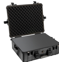
1600WF With Foam