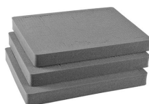
1612 Pick N Pluck; sections seulement (jeu de 3)