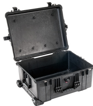
1610NF No Foam