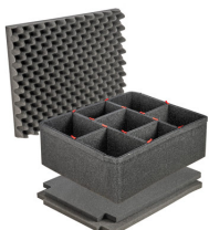
1610TPKIT Kit de séparation de la valise TrekPak