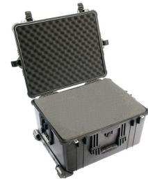
1620WF With Foam