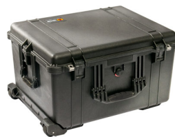
1620NF No Foam