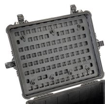
1610MP EZ-Click™ MOLLE Panel