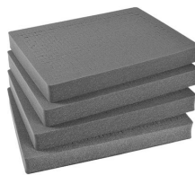
1622 Pick N Pluck: sections seulement (jeu de 4)