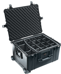
1624 With Padded Dividers