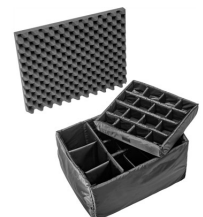
1625 Cloison en mousse