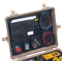
1609 Pochette couvercle