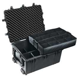
1634 With Padded Dividers