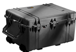
1630NF No Foam