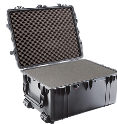
1630WF With Foam