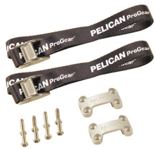
TDKIT Trousse de fixation