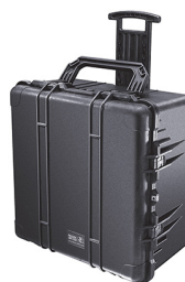
1640NF No Foam