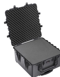
1640WF With Foam