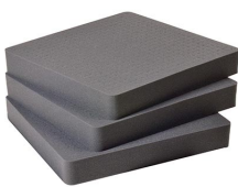
1642 Pick N Pluck; sections seulement (jeu de 3)