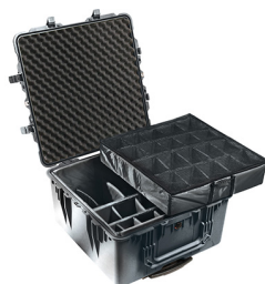
1644 With Padded Dividers