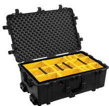
1654 With Padded Dividers