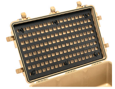
1650MP EZ-Click™ MOLLE Panel