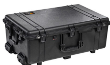
1650NF No Foam