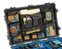
1659 Photo/Pochette couvercle