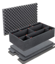
1650TPKIT Kit de séparation de la valise TrekPak