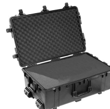
1650WF With Foam