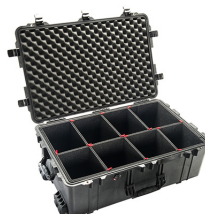
1650TP With TrekPak Divider System