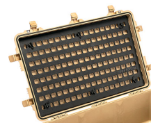
1650MP EZ-Click™ MOLLE Panel