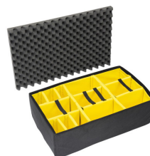
1655 Cloison en mousse