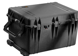
1660NF No Foam