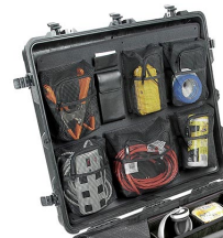
1699 Pochette couvercle