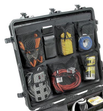
1699 Pochette couvercle