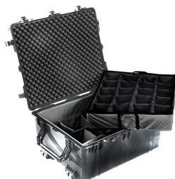
1694 With Padded Dividers