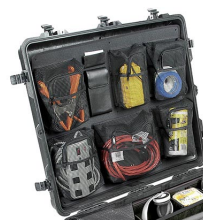
1699 Pochette couvercle