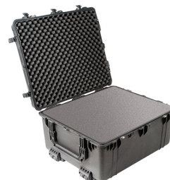
1690WF With Foam