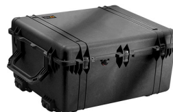
1690NF No Foam