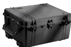
1690NF No Foam