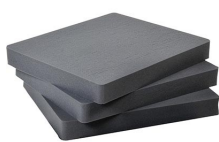
1692 Pick N Pluck; sections seulement (jeu de 3)