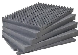
1731 Jeu de mousses de rechange, 5 pièces