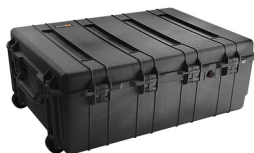
1730NF No Foam