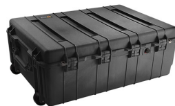
1730NF No Foam